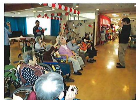
ご利用者とダンス